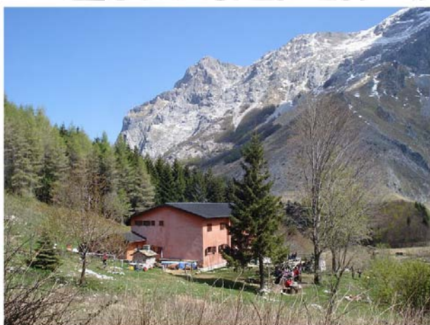
Rifugio Del Freo (m 1180)